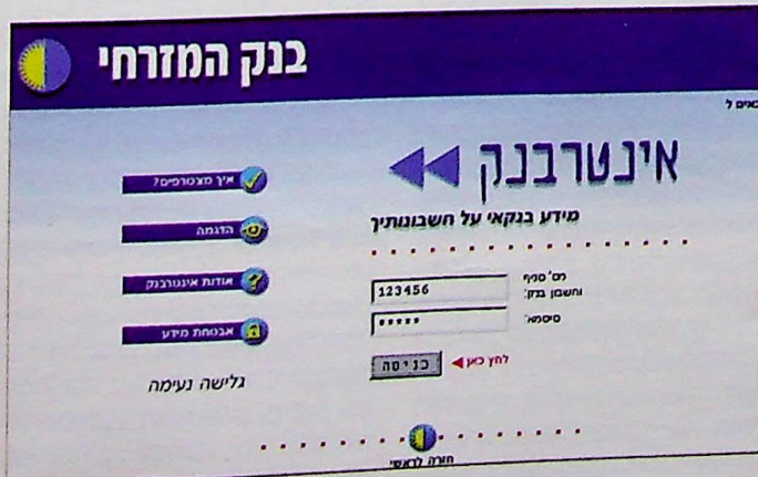
האתר של בנק המזרחי

כ-4.5 מיליון בתי אב בעולם משתמשים ברשת האינטרנט לקבלת שירותים בנקאיים. על-פי התחזיות, מספרם יגיע ל-18 מיליון עד לשנת 2002. באמצע נובמבר 1997 ניתק גם בישראל היתר למתן שירותים בנקאיים באינטרנט והבנקים כבר נערכים למתן השירות בטכנולוגיה החדשה