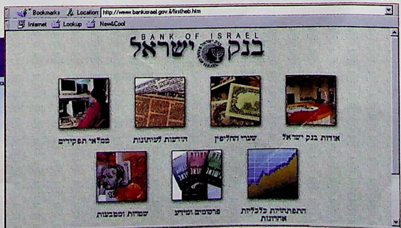
האתר של בנק ישראל